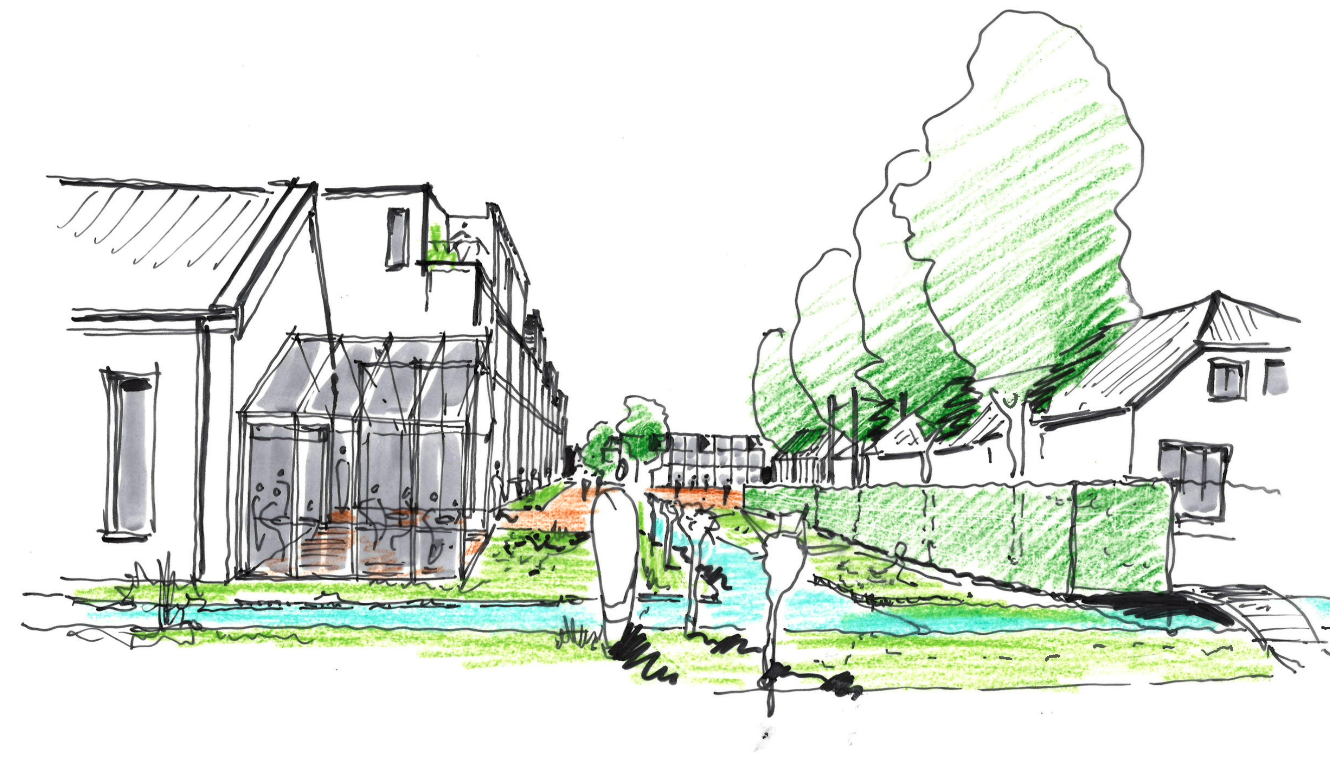
RICHTING HET HORECAPLEIN VANAF WESTKANAALWEG